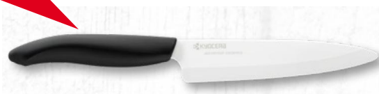
13 cm pengehosszúságú Kyocera kerámia kés